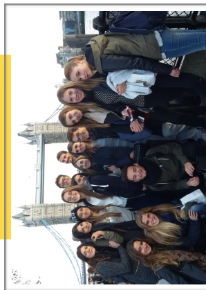
Portsmouth - "Working in the UK"