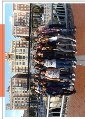
Malaga - "¿Trabajar? ¿Qué divertido!"