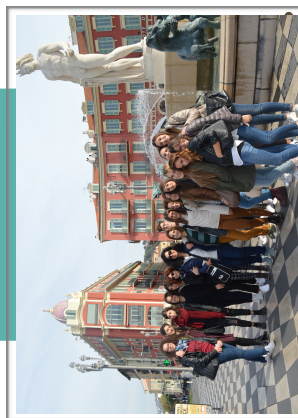
Cannes - "Travailler en France"